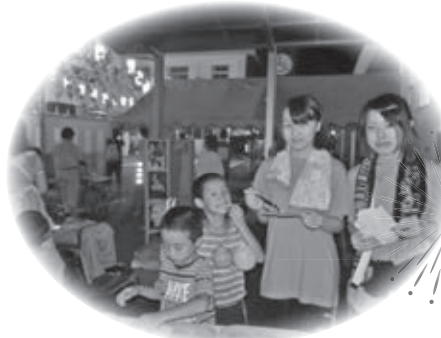
ルピナス神川ホーム