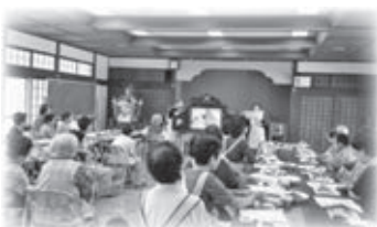
サロン事業の様子