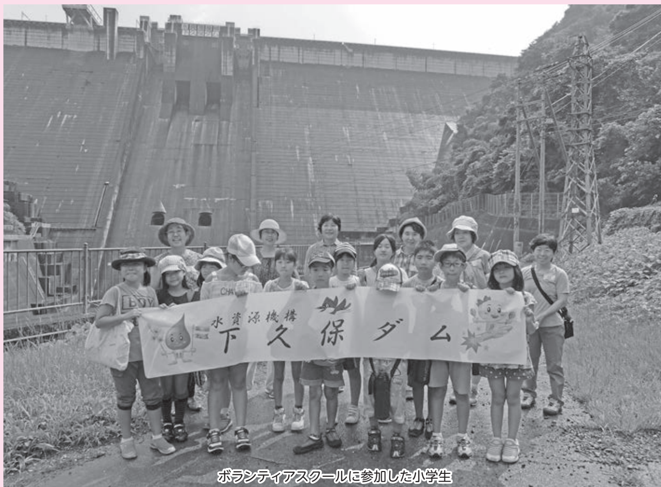
ボランティアスクールに参加した小学生