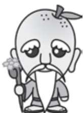
神川町マスコット神じい