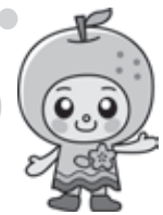
神川町マスコットなっちゃん