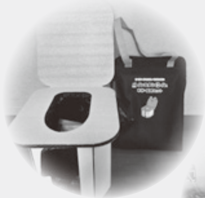
組立式簡易トイレ