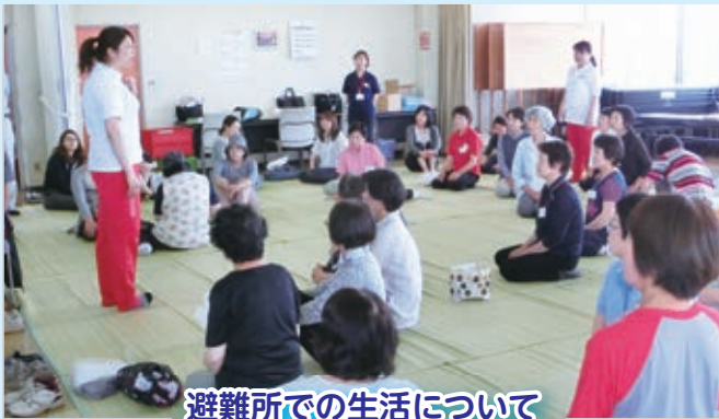
避難所での生活について