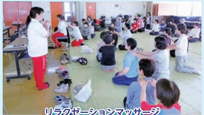
リラクゼーションマッサージ