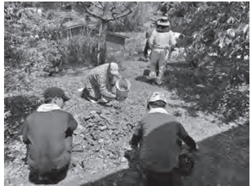
屋根瓦を手作業で片づけるボランティアさん

今回の輪島市への派遣によって、様々な学びがありました。この経験を今後の仕事にも生かしていきたいと思えます。